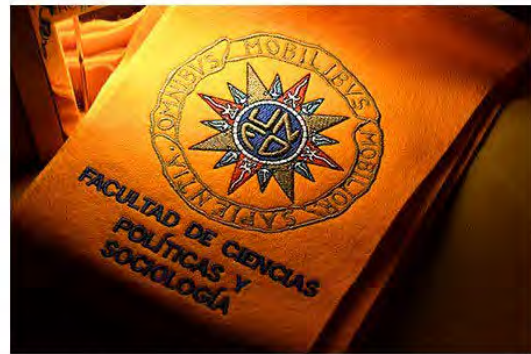
La Facultad de Ciencias Políticas y Sociología de la UNED celebró su día del patrón, San Vicente Ferrer

En este momento, vivimos un momento apasionante y plagado de desafíos para la UNED y para nuestra Facultad. Se demanda iniciativa y esfuerzo para dar forma a un futuro prometedor en la Sociedad Tecnológica y en Globalización a la que pertenecemos. En este contexto, es un privilegio encabezar una candidatura decanal que, aun siendo formalmente individual, quiere englobar a las diferentes sensibilidades e intereses de nuestra Facultad: del profesorado, el personal de administración y los estudiantes en un compromiso colectivo por la sociedad a la que todos servimos.