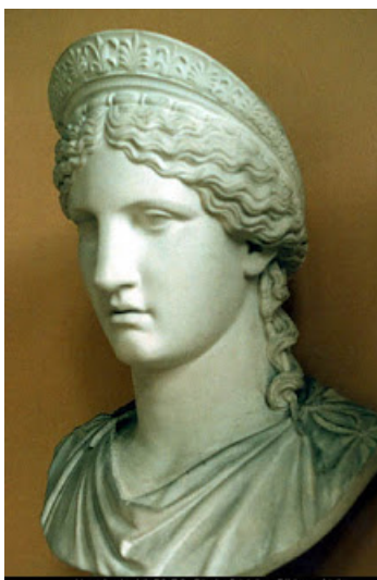
Juno. diosa del matrimonio

Del latín Iunius , junio era el cuarto mes en el primitivo calendario romano y recibió el nombre que lleva, según algunos, en honor de Junio Bruto fundador de la República romana. Otros creen que era llamado así por estar dedicado a la juventud; y, finalmente, hay quienes opinan que su nombre fue tomado de Juno (diosa del matrimonio, reina de los dioses, y deidad mayor de la religión romana que formó parte, junto a Júpiter y Minerva, de la conocida Tríada Capitolina). Es la Hera griega, hija de Rea y esposa del todopoderoso Zeus, y simboliza la maternidad.