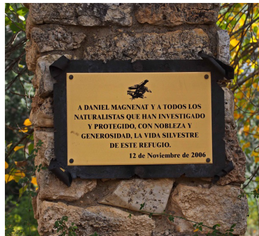
Figura 6. Placas conmemorativas. 19 de octubre de 2017).

ofrece parangón posible entre los espacios protegidos de nuestro país”. También WWF, en su revista Panda (Nº 131), señala, refiriéndose a la tarea altruista realizada, que “ gracias a este increíble trabajo las Hoces del Riaza son uno de los parajes mejor conocidos y estudiados del mundo ”.