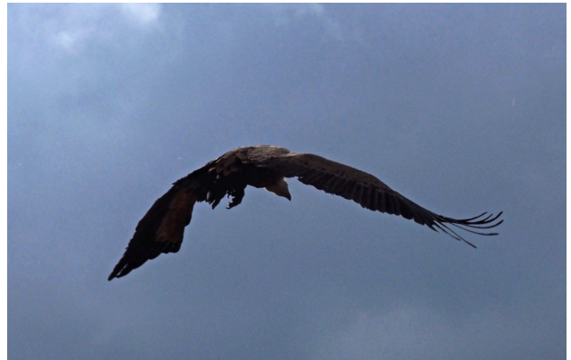
Figura 1. Buitre leonado acudiendo a un festín, en el comedero de WWF en el Refugio de Montejo. (19 de octubre de 2017).

En 1974 comenzó un proyecto increíble, utópico, distinto de todos los anteriores en España. El Refugio, promovido por ADENA a instancias de Félix, se logró gracias a la generosidad y la ilusión de muchísima gente: