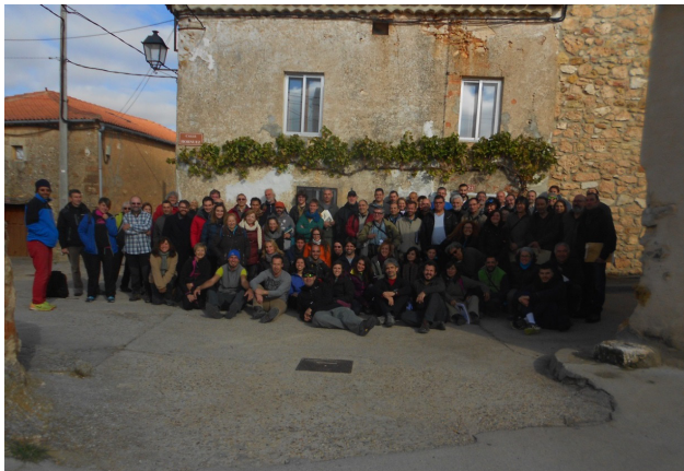
Figura 7. Participantes en el censo de otoño, en Villaverde de Montejo, el sábado 11 de noviembre de 2017.

que este rigor inspira es clave para explicar la fluidez con que se intercambia la información, bien distinta a la situación que se da en otros ámbitos, cuando algunos pretenden aprovecharse descaradamente del trabajo de los demás para su propio y exclusivo provecho”.